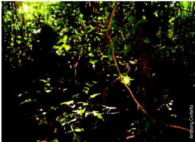
A conservation effort is needed in order to preserve these cultural artifacts for future generations.

This effort is part of commitment of the Museo Fuerte Conde de Mirasol, and it's Historical Archive of Vieques, in conjunction with The Vieques Conservation & Historical Trust, and with the Municipality of Vieques. Participating in these visits to the ruins were personnel from the Institute of Puerto Rican Culture and their departments of Museum and Parks, Patrimony and Historical Edification, and it's Archeological program; architects